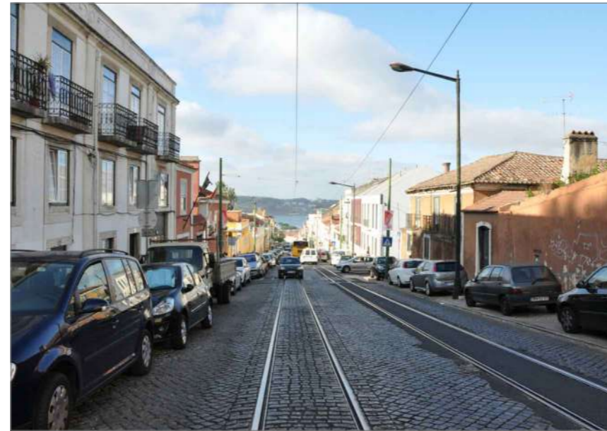
B.1 Vista Sul (1)