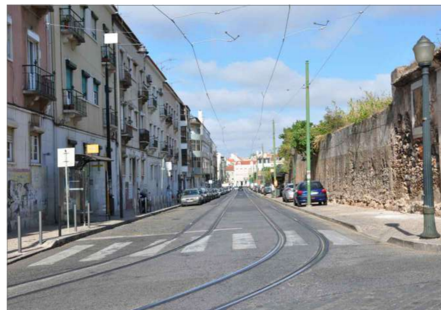
C.4 Vista Poente (3)