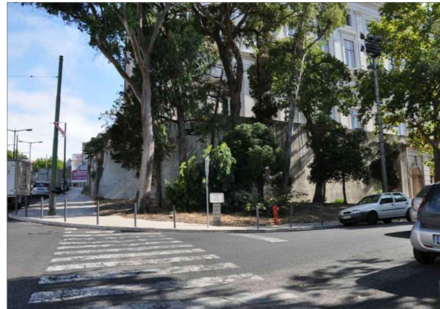
A.4 Vista Norte (Cruzamento com a Calçada da Ajuda)