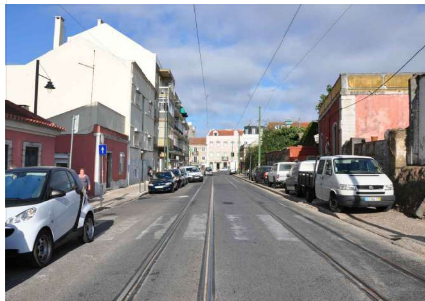
C.3 Vista Poente (2)