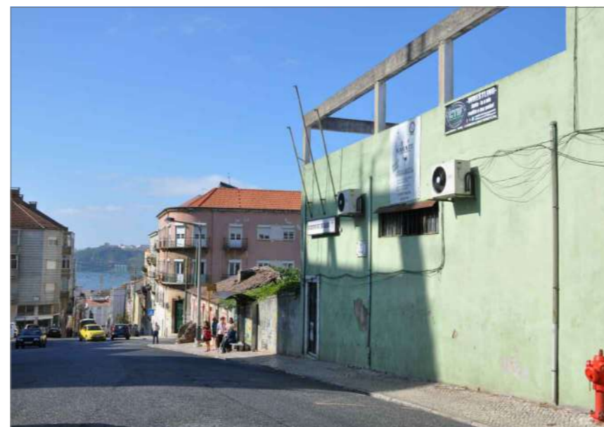
D.3 Vista Sul (2)