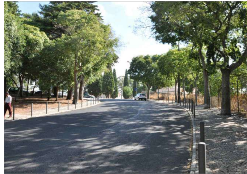
A.2 Vista Nascente