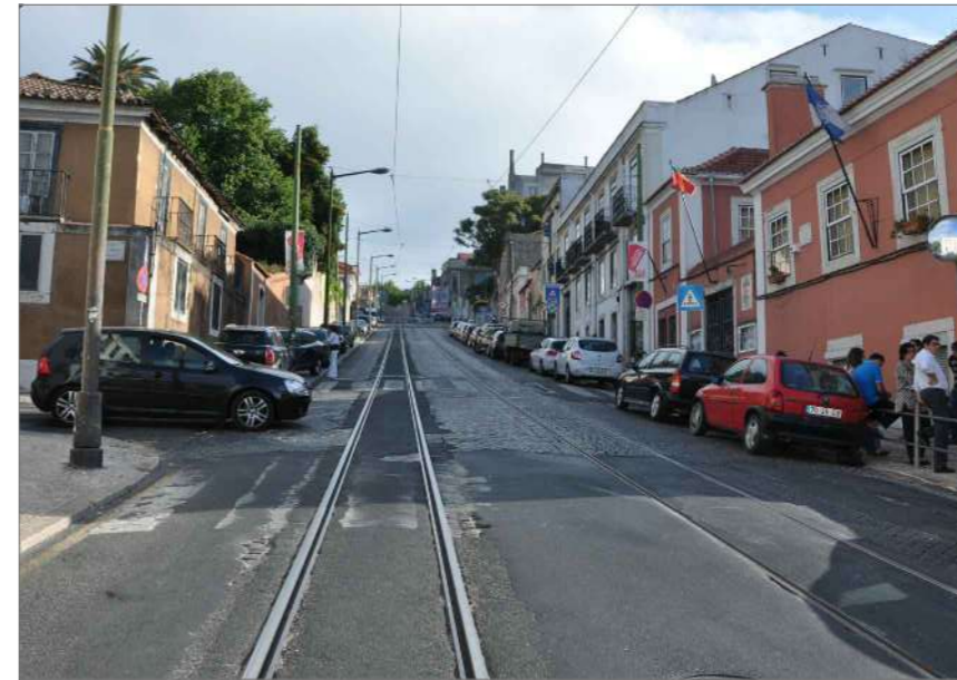
B.2 Vista Norte (1)