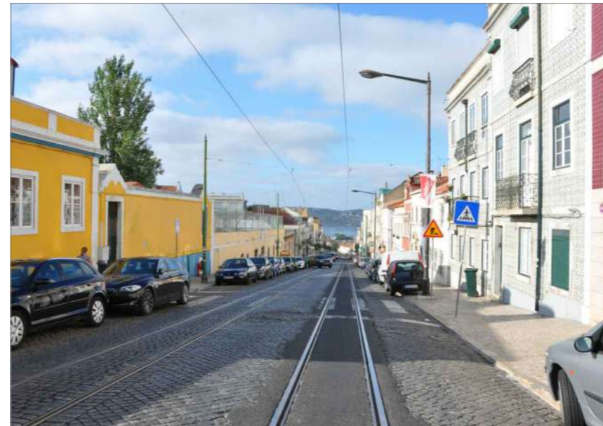
B.3 Vista Sul (2)