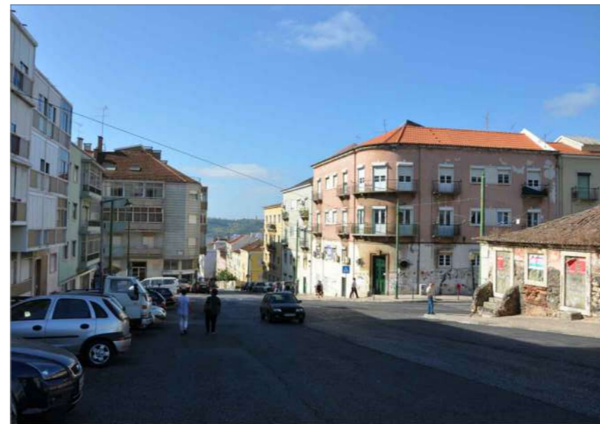
D.1 Vista Sul (Gavetos com a Rua Bica do Marquês)