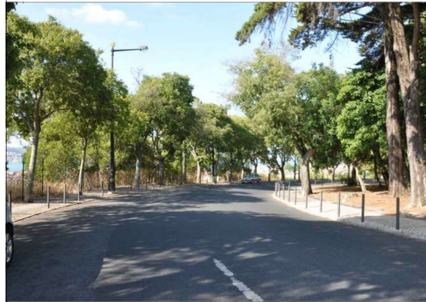
A.1 Vista Poente (1)