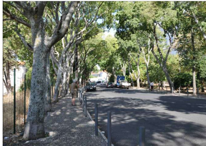
A.3 Vista Poente (2)