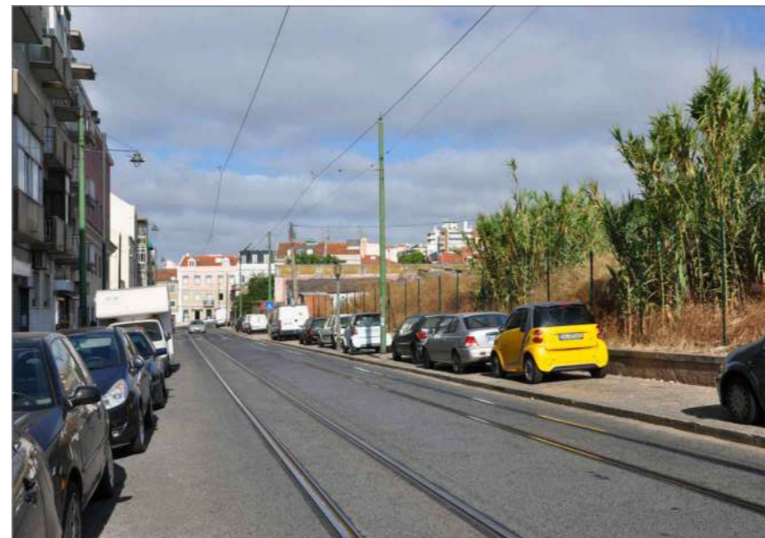
C.2 Vista Poente (1)