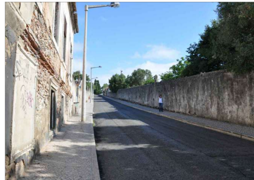
D.2 Vista Norte (1)