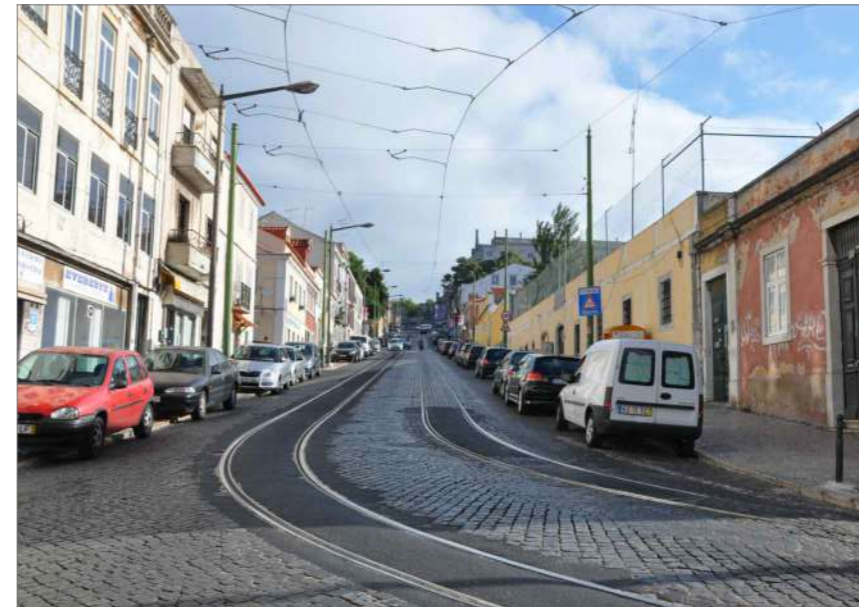
B.4 Vista Norte (Gaveto com a Rua Bica do Marquês)